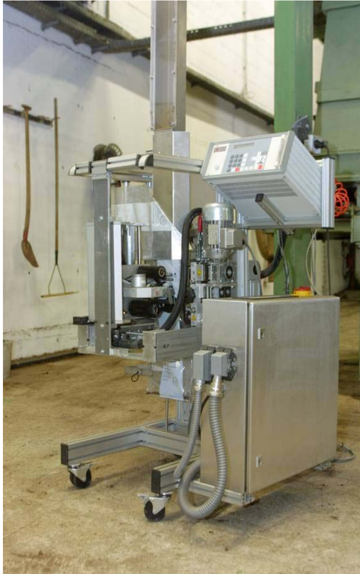
Foto zum Text : Das automatische Rückstellmuster-Erfassungsgerät entnimmt die Proben bereits während des Produktionsprozesses.