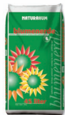
10 l / 20 l / 45 l