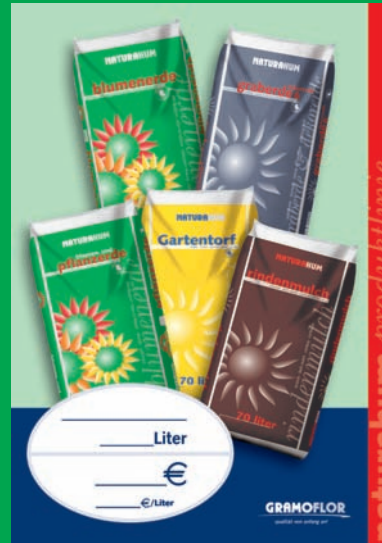
Display für den Verkauf